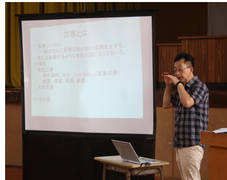
9/10 災害ボランティア講演会