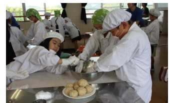
9/26 シマヤみそ造り体験(3)