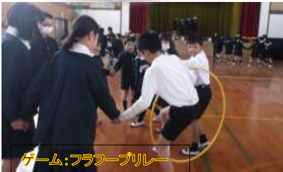
ゲーム:フラフープリレー