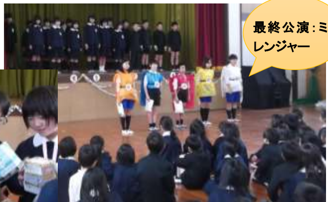
最終公演:ミワ レンジャー