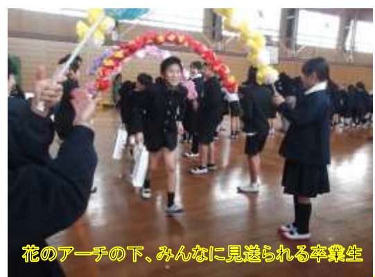
花のアーチの下、みんなに見送られる卒業生