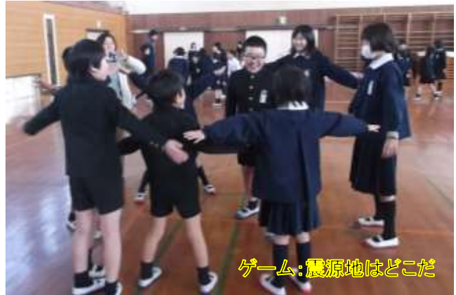
ゲーム:震源地はどこだ