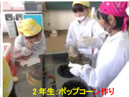
2年生:ポップコーン作り