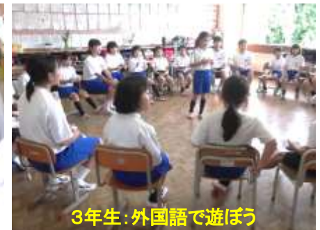
3年生:外国語で遊ぼう