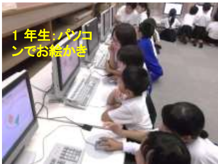
1年生:パソコンでお絵かき

大和中学校の生徒とふれあいました。頼もしいお兄さん、お姉さんと楽しい時間を過ごしました。