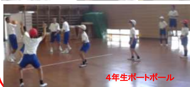
4年生ポートボール