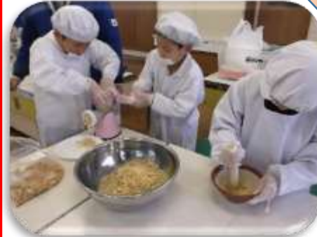
11/22(水) 国語科「すがたをかえる大豆」から 総合的な学習の時間「みそ作り」へ

5年生がミニ畳作りを体験しました。ものづくりマイスターであるプロの畳職人さんからやり方を教わりました。イグサを台紙にくるみ、縁に布をつけます。裏に和紙を貼って出来上がり。花びん敷きに使用したいという人もいました。