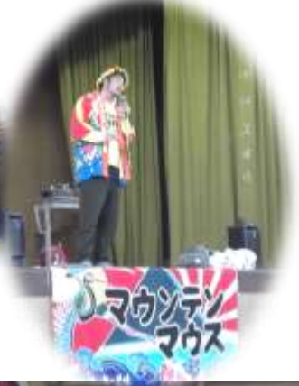
マウンテンマウスまあいコンサート