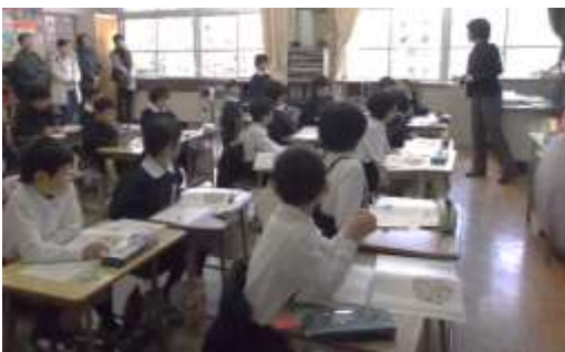
登場人物の気持ちについて考えました。

それから、明星会主催の親子ドッジボール大会。短い時間でしたが、それぞれの学年の親子対抗でゲームが行われました。どの学年も親子の意地をかけた対戦で、大きな歓声と笑い声に包まれながら、楽しく試合ができました。ご参加いただきました皆様、ありがとうございます。また、弁当の用意もありがとうございます。昼食中の子どもたちは笑顔いっぱいでした。参観日アンケートへのご協力にも感謝申し上げます。