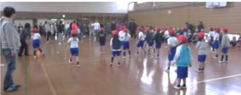
親子ふれあいドッジボール・・・お父さん・お母さんとの勝負に笑顔の花が咲きました。