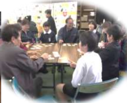
6年生…ふれあい交流会