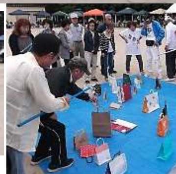
宝つり…何がつれるかな