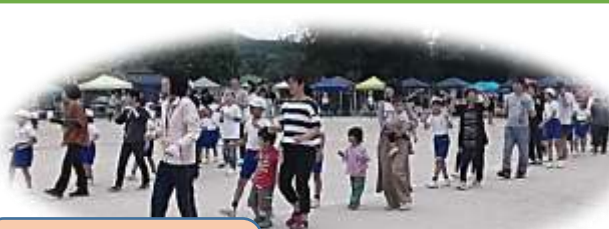
「大和音頭」子どもたちと保護者、地域の皆様と一緒に踊りました。