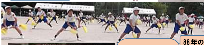
88年の伝統の三輪行進