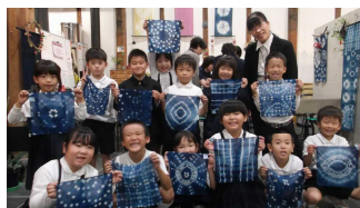
やない西蔵染め物体験(1年)