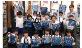
やない西蔵染め物体験(2年)