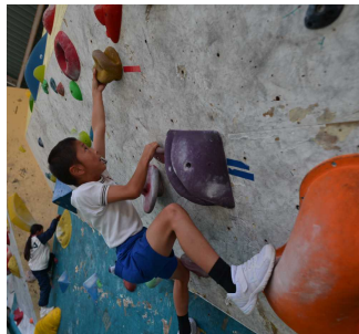
ボルダリング体験(4年)