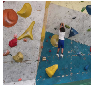
ボルダリング体験(3年)