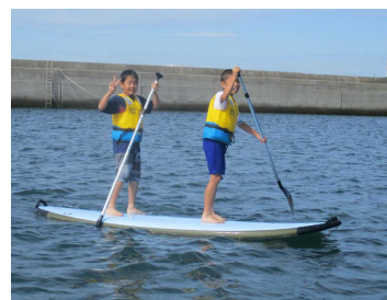
サップ操船体験:男子編