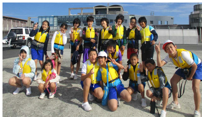
海洋体験:スポーツ交流村にて

なお、行き帰りの交通は、大和社会福祉協議会のご厚意で、バスを手配してくださいました。ありがとうございました