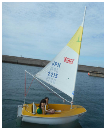
ディンギー操船体験