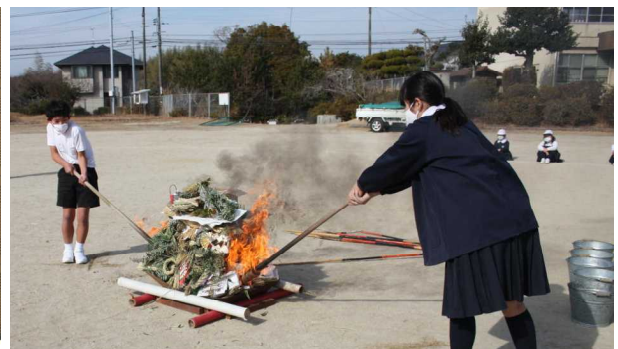
年男・年女が火入れをしたどんど焼き