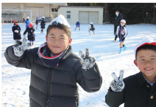
頭に雪をのせてはい、ポーズ