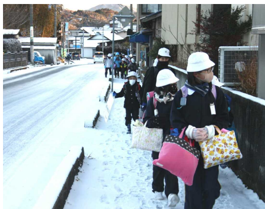
大雪の中登校する子どもたち

暗いニュースが多い中、いつ聞いても子どもたちの喜ぶ声は、みんなの心を明るく・温かくしてくれます。