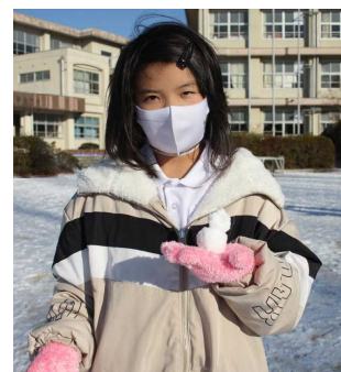
ミニ雪だるまができたよ