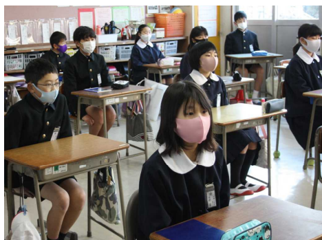
始まりの会を静かに聴く6年生