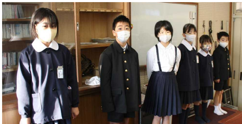
放送で新年の誓いを発表する子どもたち