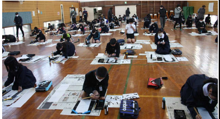
真剣に書き初めに取り組む3～6年生